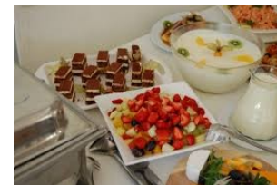
Essen und Trinken